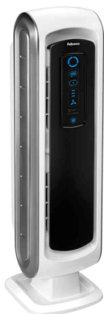
Luftreiniger AeraMax DX5