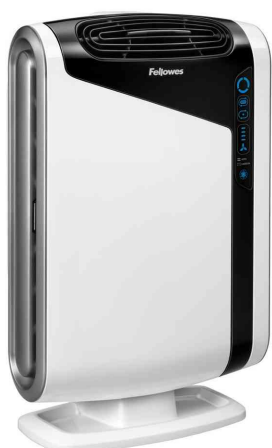
Luftreiniger AreaMax DX95