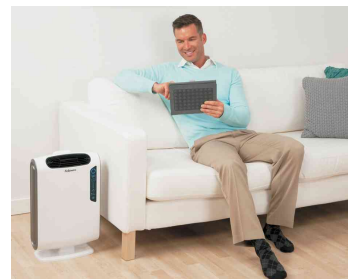
Luftreiniger AreaMax DX95, Anwendung