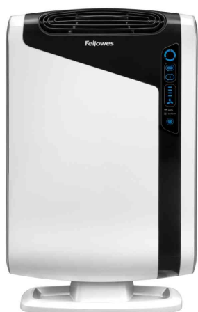
Luftreiniger AreaMax DX95